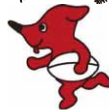
千葉県PRマスコットキャラクター チーバくん 千葉県許諾 第A149-3号